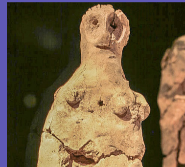
Bild rechts: In einem Fluchritual verwendete Zauberpuppe mit Einstich- stellen aus dem Heiligtum der Isis und Mater Magna